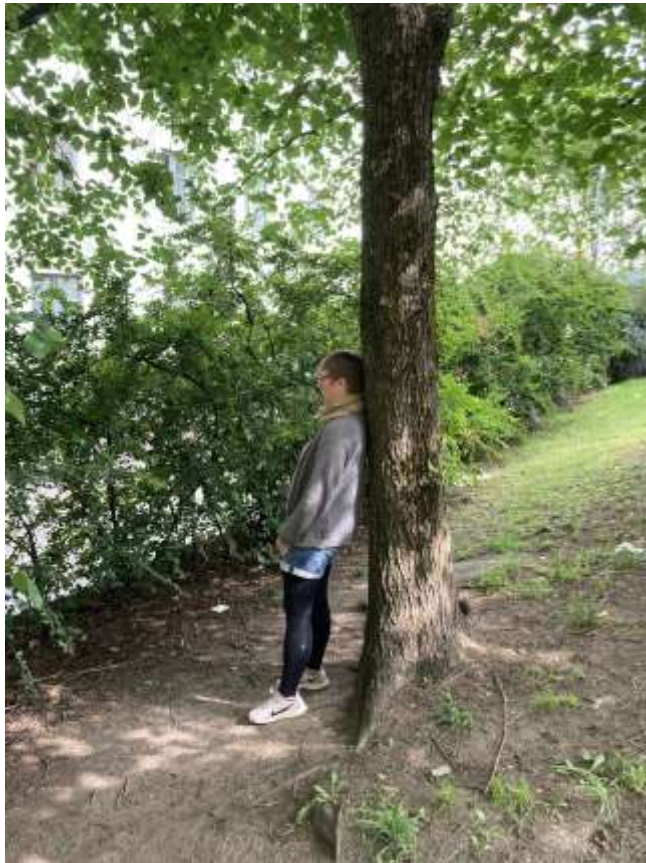
Nojaa ensin selkä puuta vasten (kuten kuvassa) ja piirrä sitten kaverikuva itsestäsi ja puusta!